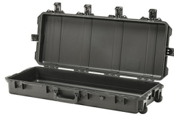
iM3100-X0000 No Foam