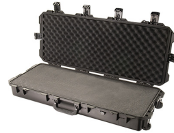
iM3100-X0001 With Foam