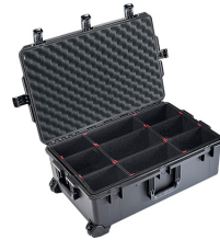
iM2950-X0006 With TrekPak Divider System