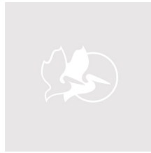
iM2950-X0002 With Padded Dividers