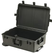
iM2950-X0000 No Foam