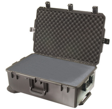
iM2950-X0001 With Foam