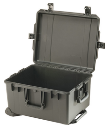
iM2750-X0000 No Foam