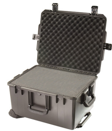
iM2750-X0001 With Foam