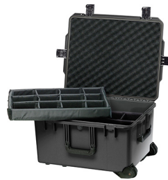
iM2750-X0002 With Padded Dividers