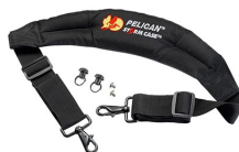
iM-STRAP-S-VER2 Padded Shoulder Strap