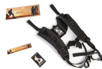
RucPac-normal Conversione zaino RucPac standard Hardcase