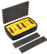
1535AirDS Set di divisori imbottiti