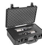
WHISKEY-2B 2 Bottle Whiskey