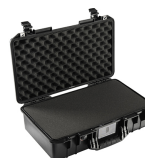
1525WF With Foam