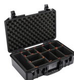
1525TP With TrekPak Divider System