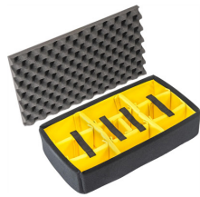
1525AirDS Set di divisori imbottiti