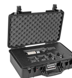
WHISKEY-1B Single Bottle Whiskey