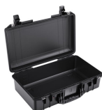
1525NF No Foam