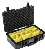
1525WD With Padded Dividers