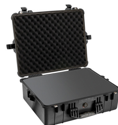
1600WF With Foam