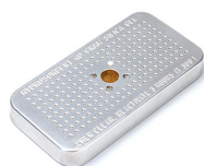
1500D Gel di silice essiccante