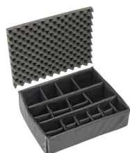
1605 Set di divisori imbottiti