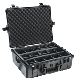
1604 With Padded Dividers