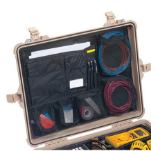
1609 Coperchio organizer