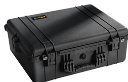
1600NF No Foam