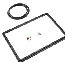
1450PF Telaio del pannello per applicazioni speciali