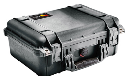
1450NF No Foam