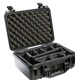
1454 With Padded Dividers