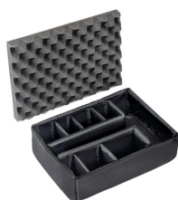
1455 Set di divisori imbottiti