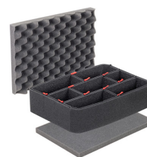
1450TPKIT Kit divisorio per valigie TrekPak