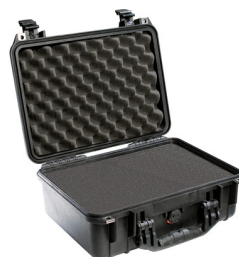
1450WF With Foam