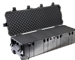
1740WF With Foam