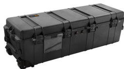
1740NF No Foam