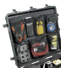
1699 Coperchio organizer