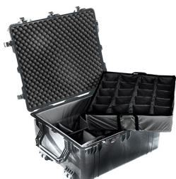
1694 With Padded Dividers