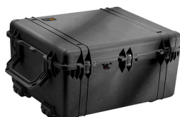
1690NF No Foam