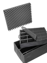
1645 Set di divisori imbottiti