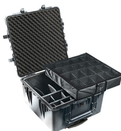
1644 With Padded Dividers