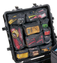
0379 Coperchio organizer