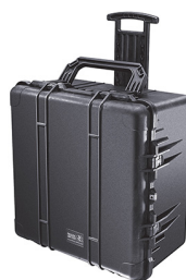
1640NF No Foam