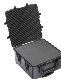
1640WF With Foam