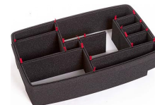
1510EUTP Kit divisorio per valigie TrekPak