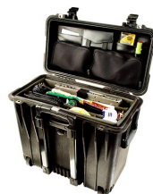
1446 Set di divisori e coperchio organizer per ufficio