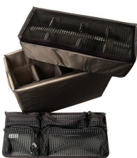
1445 Set di divisori imbottiti e coperchio organizer per accessori