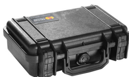
1170NF No Foam