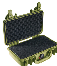
1170WF With Foam