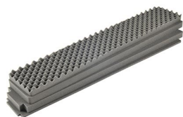
iM3410-FOAM 4 pz. set ricambio schiuma