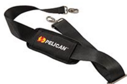
9487 Padded Shoulder Strap