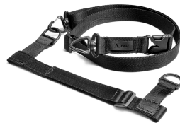
MSTRAP Tracolla per Micro Case