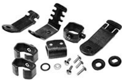
0770 Fissaggio da torcia per caschi