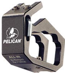
0782 Fissaggio da torcia per caschi