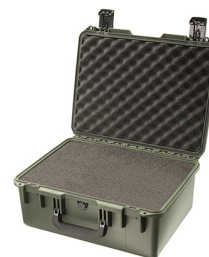
iM2450-X0001 With Foam