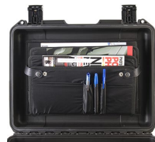
iM24XX-LIDORG Coperchio organizer