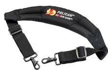
iM2370-STRAP-S Removal Padded Shoulder Strap