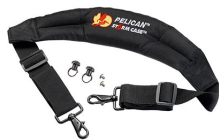
iM-STRAP-S-VER2 Padded Shoulder Strap