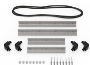
iM2200-MBEZ-B Lunetta della base (metrica)