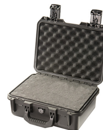
iM2100-X0001 With Foam