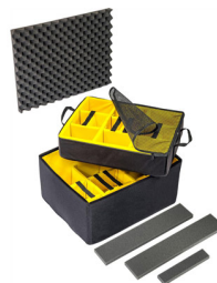
1637AirDS Set di divisori imbottiti