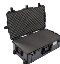
1615WF With Foam