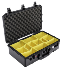
1555WD With Padded Dividers