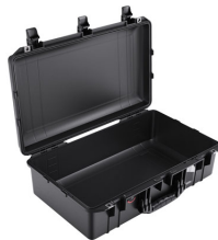
1555NF No Foam