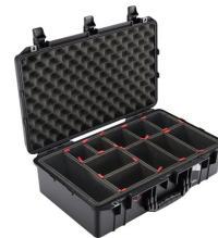
1555TP With TrekPak Divider System