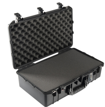
1555WF With Foam