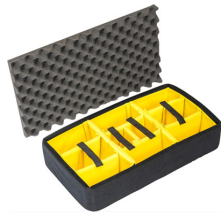
1555AirDS Cloison en mousse