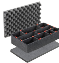
1485TPKIT Kit de séparation de la valise TrekPak