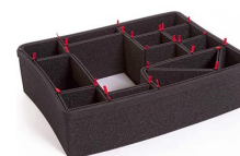
1550EUTP Kit de séparation de la valise TrekPak