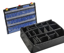
1555EMS Trousse d'accessoires EMS (classeur pour couvercle et jeu de séparateurs)