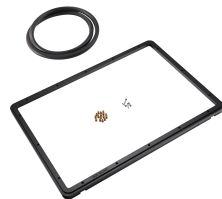
1520PF Cadre de panneau pour application spéciale