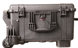
1620MNF No Foam