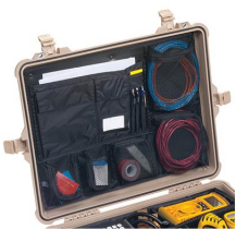
1609 Pochette couvercle