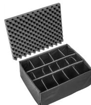
1615 Cloison en mousse