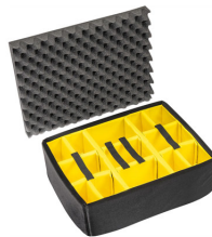
1565 Cloison en mousse