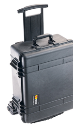
1560MWF With Foam