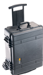
1560MNF No Foam