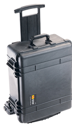
1560MNF No Foam