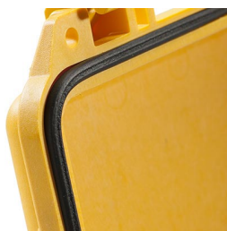
1703 Joint torique de remplacement