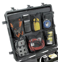
1699 Pochette couvercle