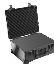
1560WF With Foam