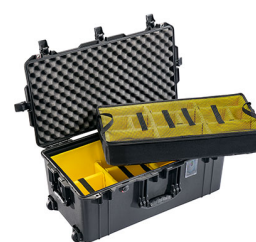
1626WD With Padded Dividers