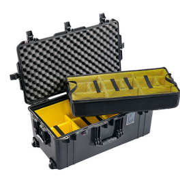
1626WD With Padded Dividers