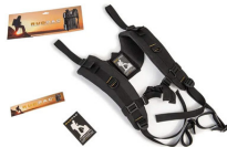
RucPac-normal Conversion sac à dos RucPac standard Hardcase