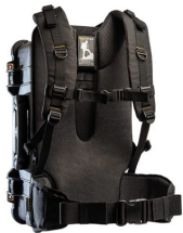
RucPac-Pro-1 Conversion sac à dos RucPac Pro Hardcase