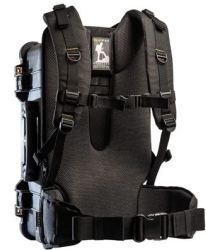
RucPac-Pro-1 Conversion sac à dos RucPac Pro Hardcase