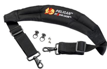
iM-STRAP-S-VER2 Bandoulière rembourrée