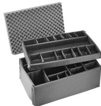
iM3075-DIV Cloison en mousse