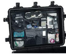
iM3075-UTILITYORG Pochette utilitaire