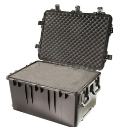
iM3075-X0001 With Foam