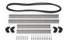
iM2620-M4-BEZEL Lunette de base (métrique)