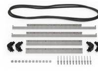
iM2620-M4-BEZEL-L Lunette du couvercle (métrique)