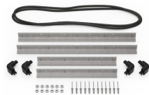
iM2600-MBEZ-B Lunette de base (métrique)