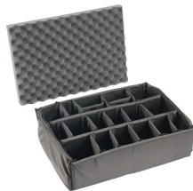
iM2600-DIV Cloison en mousse