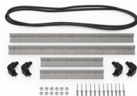
iM2500-MBEZ-B Lunette de base (métrique)