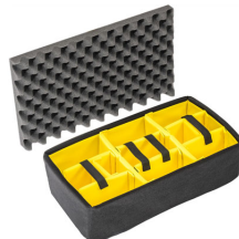
iM2500-DIV Cloison en mousse