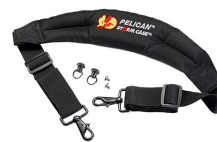
iM-STRAP-S-VER2 Bandoulière rembourrée