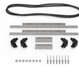
iM2306-M4-BEZEL-L Lunette du couvercle (métrique)