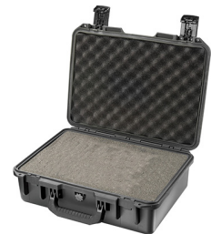
iM2300-X0001 With Foam