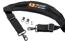
iM-STRAP-S-VER2 Bandoulière rembourrée