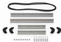
iM2300-MBEZ-B Lunette de base (métrique)