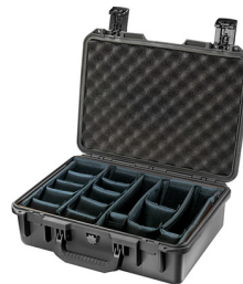
iM2300-X0002 With Padded Dividers