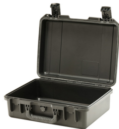
iM2300-X0000 No Foam