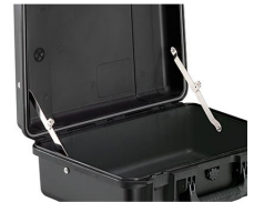
iM-LIDSTAY Compas de couvercle