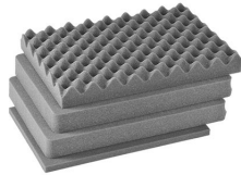
iM2300-FOAM Jeu de mousses de rechange, 4 pièces