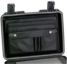
iM2300-LIDORG Pochette couvercle