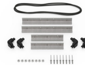
iM2100-MBEZ-B Lunette de base (métrique)