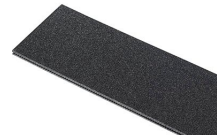
1500TPDIV Séparateurs TrekPak supplémentaires