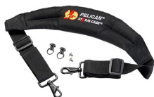
iM-STRAP-S-VER2 Bandoulière rembourrée