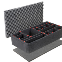
1605TPKIT Kit de séparation de la valise TrekPak