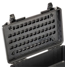
1535MP EZ-Click™ MOLLE Panel