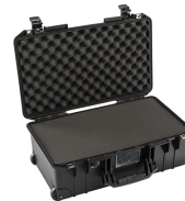
1535WF With Foam