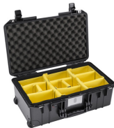
1535WD With Padded Dividers