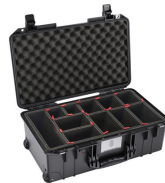
1535TP With TrekPak Divider System