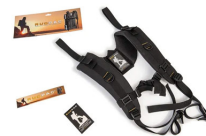
RucPac-normal RucPac Standard Hardcase Rucksack-Konvertierung