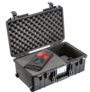
1535AIRTPF TrekPak / Foam Hybrid