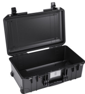
1535NF No Foam