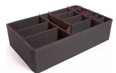
1650EUTP TrekPak Koffer Teiler Kit