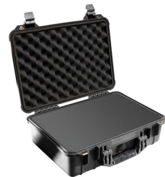
1500WF With Foam